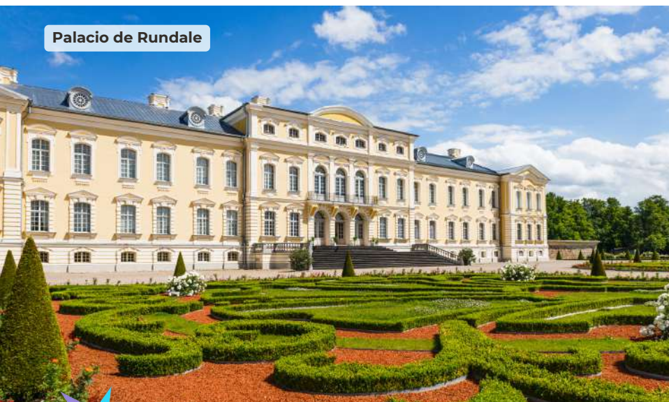
Palacio de Rundale