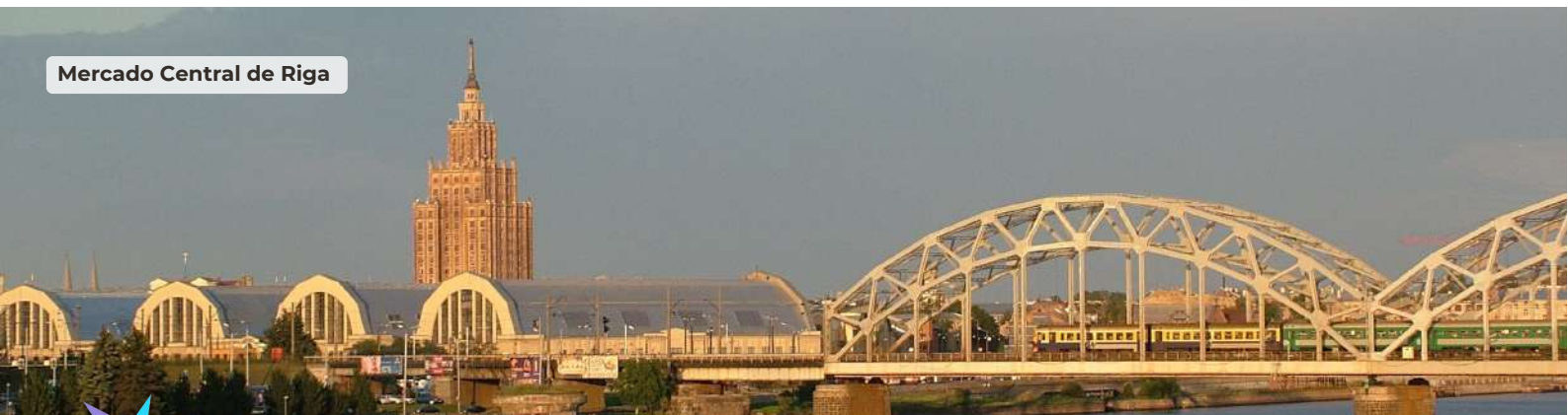
Mercado Central de Riga

Visita del Mercado Central de Riga. Es el mayor mercado de los Países Bálticos y uno de los mayores de Europa. Inaugurado en 1930, e inicialmente destinado a hangares para zeppelines, fue el mayor proyecto arquitectónico en la Letonia de entreguerras, imponente construcción de 5 grandes naves de estilo art nouveau en pleno centro de Riga.